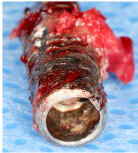
Implantatfraktur – Zustand nach Explantation